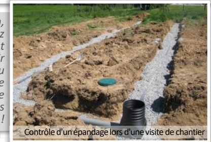
Contrôle d'un épandage lors d'une visite de chantier

Attention, vous devez impérativement attendre d'avoir reçu l'avis du SPANC sur votre projet avant de réaliser vos travaux !